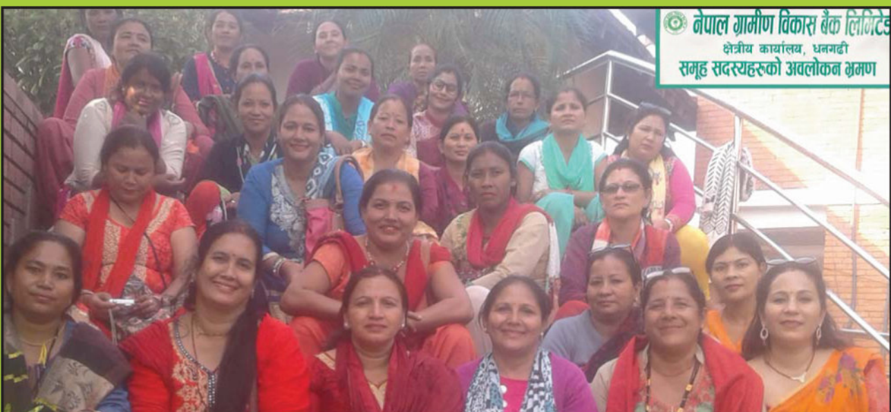
बैंकका समूह सदस्यहरु अवलोकन भ्रमणमा