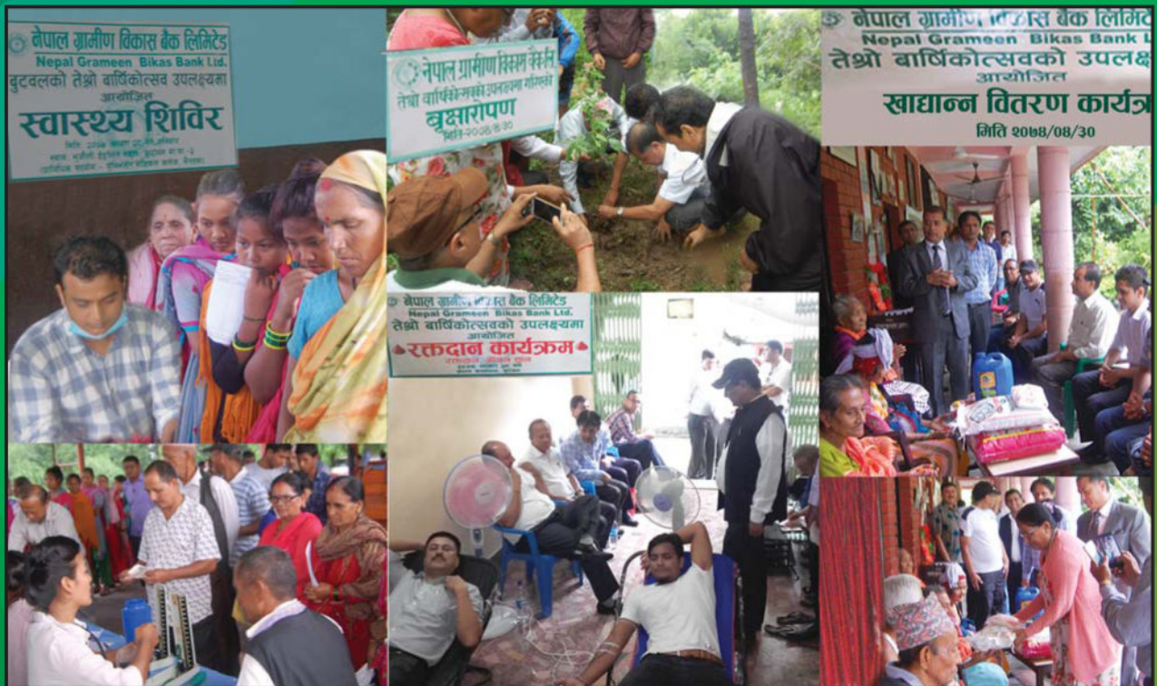
बैंकको तेस्रो वार्षिकोत्सवको अवसरमा आयोजित विभिन्न सामाजिक कार्यक्रमका कलकहरु