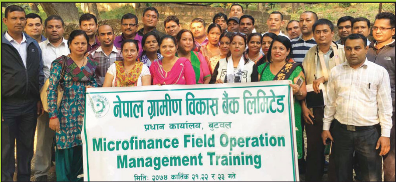
तालिम कार्यक्रममा सहभागी बैंकका कर्मचारीहरु