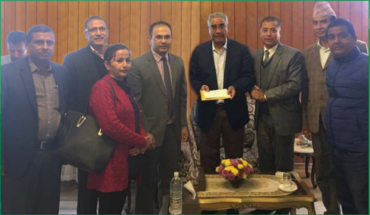
बाढी पहिरो पीडितहरुको सहयोगार्थ बैंक परिवारबाट संकलित रकमको चेक सम्माननीय प्रधानमन्त्रीज्यू समक्ष हस्तान्तरण