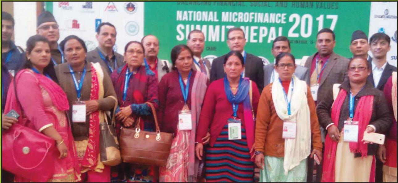
चौथो लघुवित्त सम्मेलनमा सञ्चालक समितिका अध्यक्ष, कर्मचारी एवम् समूह सदस्यहरुको सहभागिता